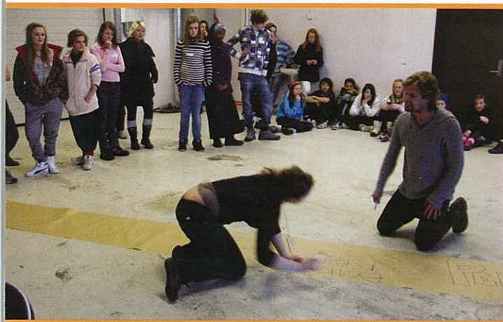
Fra utviklingen av forestillingen «Spor gjennom ingenmannsland». Referansegruppen ser på og gir tilbakemelding.